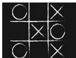
Boter kaas en eieren